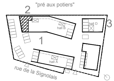
Plan de repérage sans échelle

ILOT C6-Ecoquartier Maisonneuve rue de la SIGNOLAIS 44 350 GUERANDE