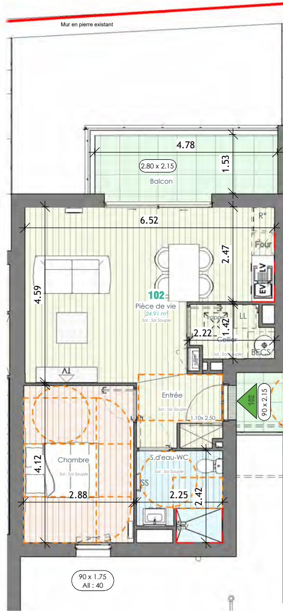
Plan du logement Ech : 1 : 100