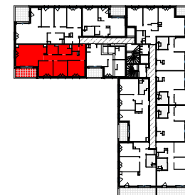
PLAN DE REPERAGE - SANS ÉCHELLE