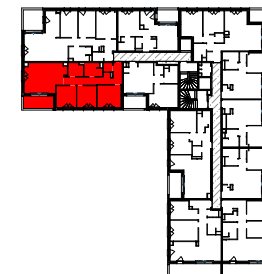
PLAN DE REPERAGE - SANS ÉCHELLE