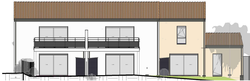
Elévation Sud Ech : 1 : 150