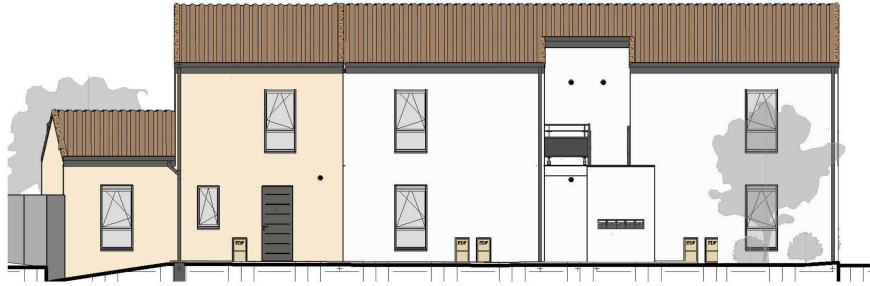
Elévation Nord Ech : 1 : 150