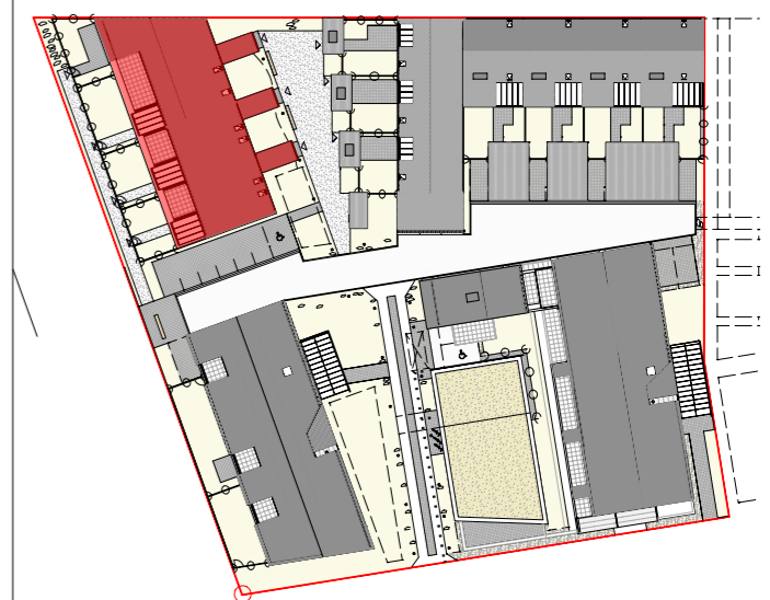
Plan de repérage du bâtiment