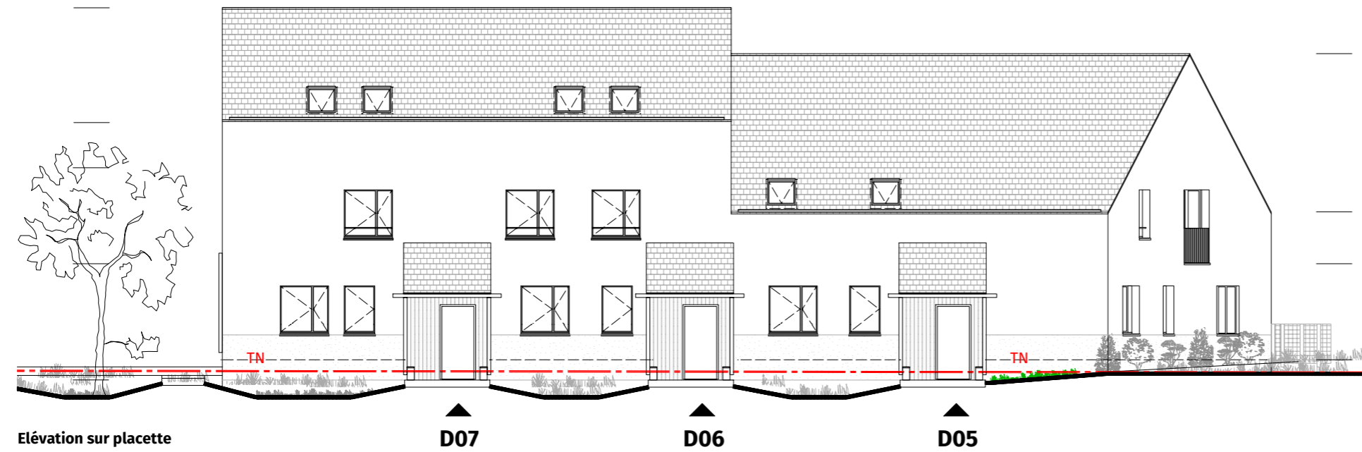
Elévation sur placette