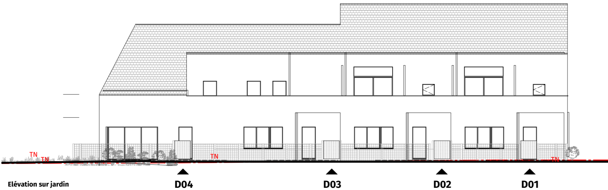
Elévation sur jardin