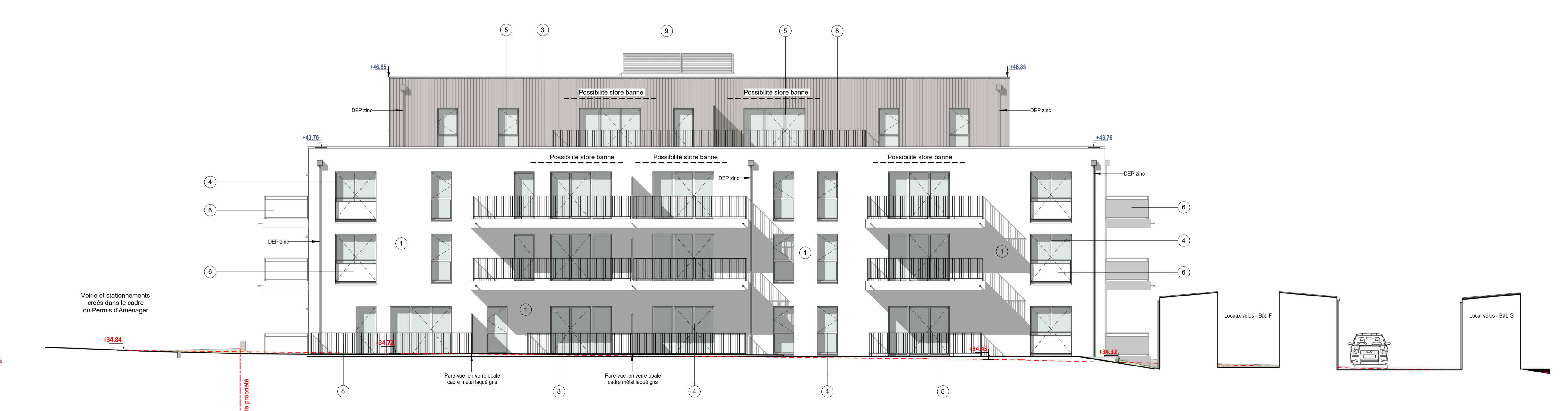
Bât. F - Façade Sud-Ouest éch. : 1 : 100