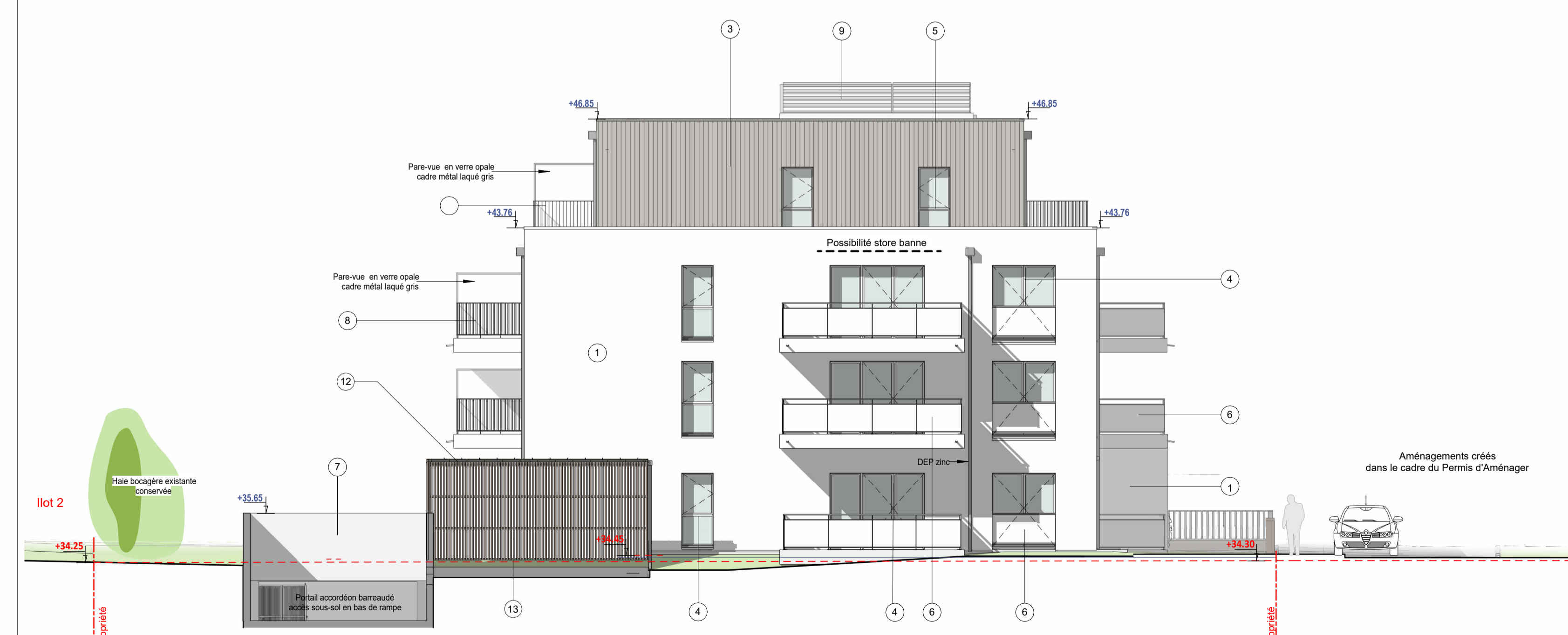
Bât. F - Façade Sud-Est éch. : 1 : 100